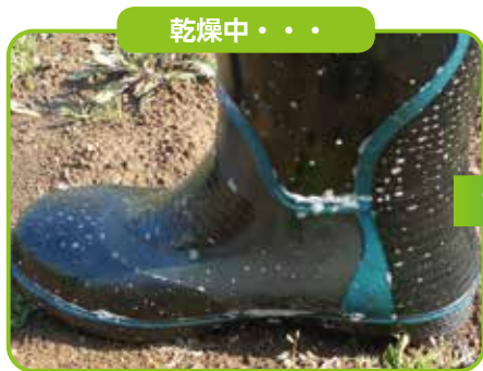
長靴へ十分量を散布した直後の様子