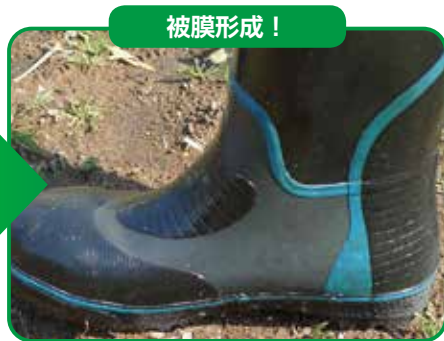
薬剤処理面を乾燥させた後の様子