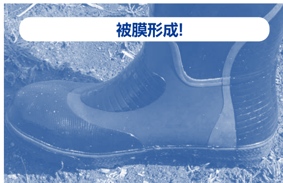
薬剤処理面を乾燥させた後の様子