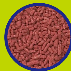
ガードベイトAの形状