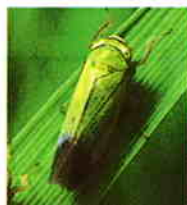
ツマグロヨコバイ