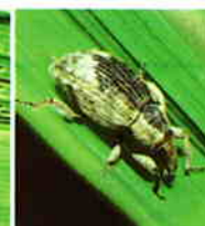
イネミスゾウムシ