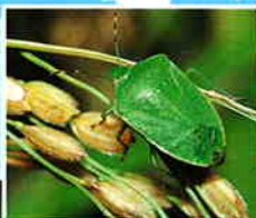
ミナミアオカメムシ