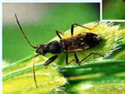
コバネヒョウタンナガカメムシ