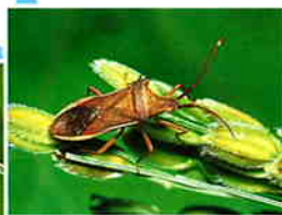
ホソハリカメムシ