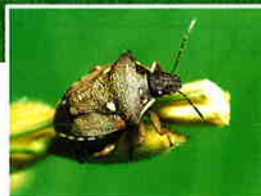
オオトゲシラホシカメムシ