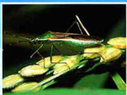
クモヘリカメムシ