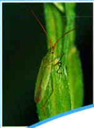
アカヒゲホソドリカスミカメ