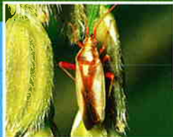
アカスジカスミカメ