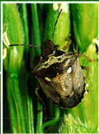
トゲシラホシカメムシ