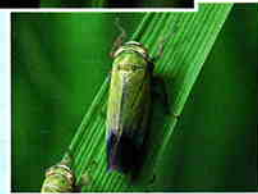
ツマグロヨコバイ