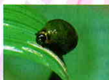
イネドロオイムシ