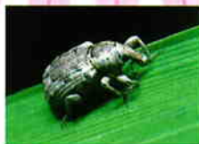
イネミスゾウムシ