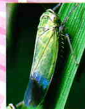
ツマグロヨコバイ